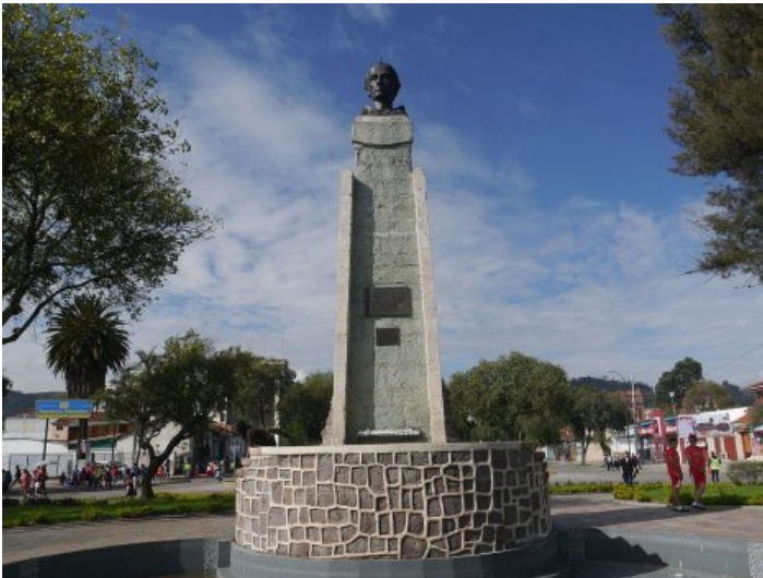
Monument à la mémoire de Frère Vicente Solano - Cuenca